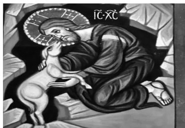
Icono La oveja Perdida

DILIGENCIA: deseo de hacer con interés, esmero, rapidez y eficacia