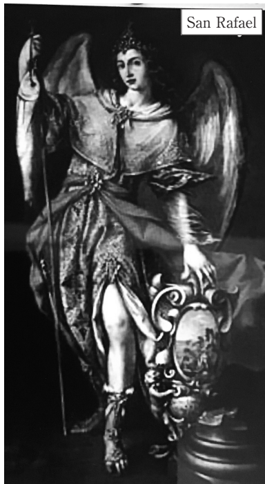
ARCÁNGEL SAN RAFAEL

Según el libro de Tobías (5,4) Rafael fue enviado por Yahveh para acompañar a Tobías en un peligroso viaje para conseguirle una esposa piadosa.