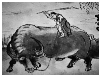
Sesshu Amaestrando el buey