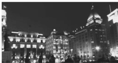
旧東インド会社時代の建物群(バンド)