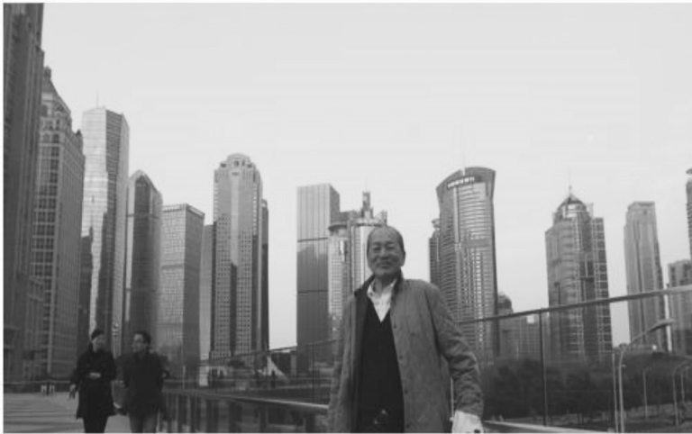
金融街の有名な “栓抜きビルディング”（左）