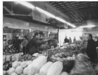
昔ながらのマーケットも健在！