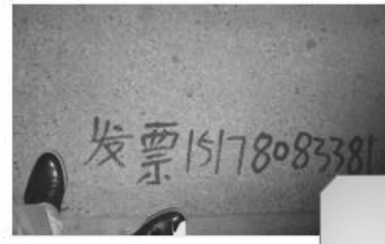
バス停 足元には秘密の電話番号

マンションは、すべて土地は国の物で、建物の 所有、利用権が売買される。3LDKを買うのに、 1～2億円。庶民は買えない。地方で石炭等で 財を成したものが1棟買いなどのケースが多い。 公務員は、マンションスペースが与えられるが、 そこを売ってしまうと住むところがない。 賃料は、15～20万円/3LDK程度。3人で同居 シェアして住み、外資勤務でも家賃で給料の 1/2～1/3は消える。貧富の格差固定が進む。 出かける時は、どこもトイレ用のちり紙は必携だ。